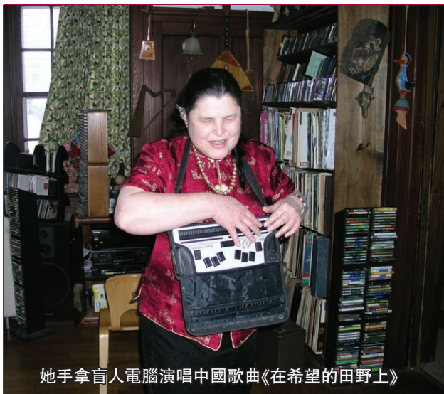
她手拿盲人電腦演唱中國歌曲《在希望的田野上》