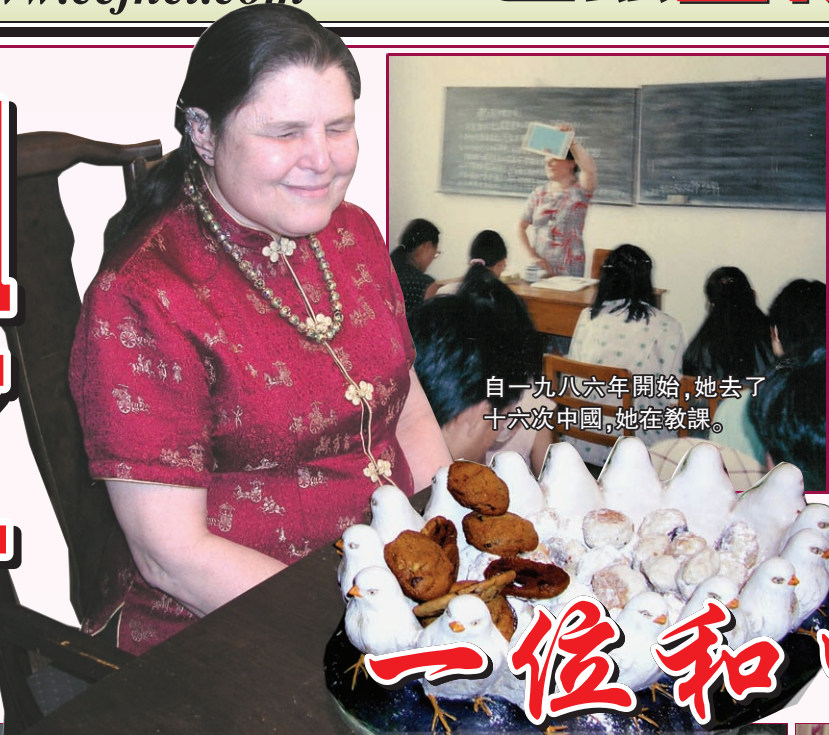
自一九八六年開始,她去了十六次中國,她在教課。