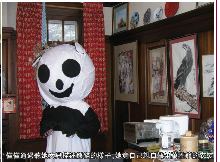
僅僅通過聽她女兒描述熊貓的樣子,她竟自己親自做出萬牲節的衣裝