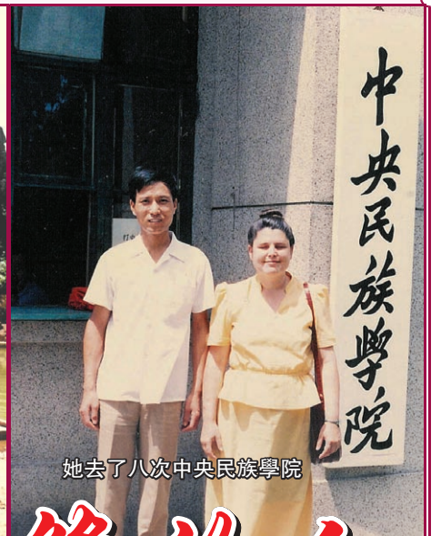
她去了八次中央民族學院