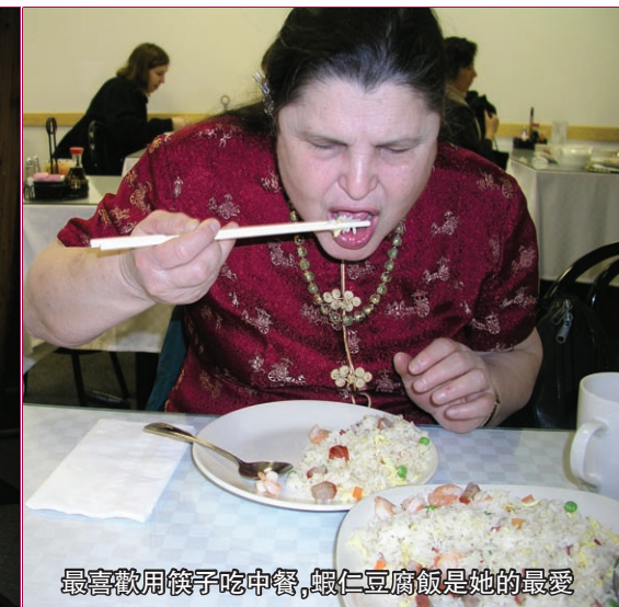
最喜歡用筷子吃中餐,蝦仁豆腐飯是她的最愛