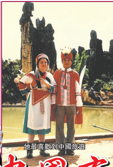
她最喜歡到中國旅遊