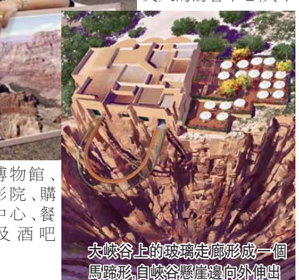
大峽谷上的玻璃走廊形成一個馬蹄形,自峽谷懸崖邊向外伸出

金鵠稱,將來情侶甚至有望在玻璃廊橋上舉辦一場浪漫的「空中婚禮」。玻璃走廊主體結構於2004年3月動工,空中玻璃走廊位於著名的大峽谷西面「老鷹峽」景區,同時計劃建設中的還有一座三層佔地6,000平方英尺的訪客中心,其中