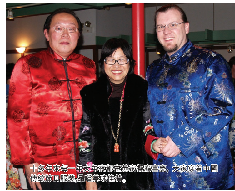
十多年來每一年大年夜都在這歡慶團圓。大家穿著中國傳統節日服裝,品嚐美味佳餚。

雪,在窗外疯狂地飘,连绵不断的雪花让临近过年的世界一片洁白。多年没有见到这么疯狂厚实的雪,我心中不禁感叹:传说中的林海雪原是否就是这番景致?“瑞雪照丰年”,年关的大雪应该是新一年的最好礼物,预示着人们期待的金猪年果然会带给人们金玉满堂、五谷丰登。