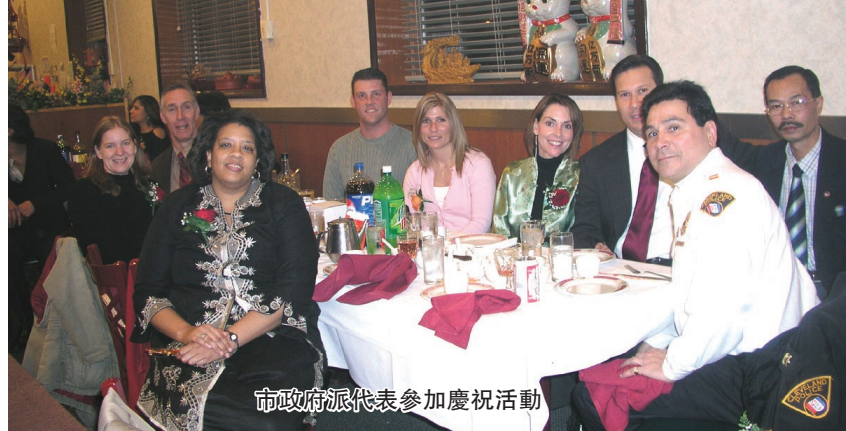
市政府代表參加慶祝活動