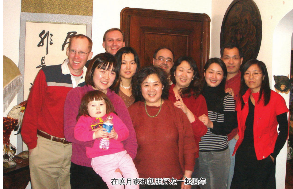
在曉月家和親朋好友一起過年

級家庭。美麗的聖誕樹是節日的必備。近千只的小燈泡和姿態各異的聖誕挂件一棵聖誕樹裝點得晶瑩剔透,宛如火樹銀花,烘托出了熱烈的節日氣氛;戶外開闊的花園也進行了精心佈置,各種有趣的聖誕吉祥物,和着高大繁茂的樹木,在無數彩燈映照下,整個花園宛如一片璀璨的童話仙境。聖誕禮物必須是個驚喜。所以要悄悄地採辦,精心地包裝再悄悄地放到聖誕樹下。我是過了子夜才躡手躡腳、黑燈瞎火地