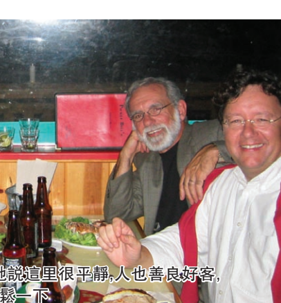
蘭子已經很習慣美國生活,她說這里很平靜,人也善良好客,周末和朋友上酒吧喝一杯放鬆一下

則隨意聊天,閱讀,外出散步,逛街購物,或和孩子們一起瘋天瘋地地玩電子遊戲,特別有意思的是家長玩不過孩子時也可以任性耍賴,完全不用一本正經端着長輩的架勢。所以朋友家始終別有一番輕鬆,祥和甚至清靜。女主人並不特別安排大家的吃,尤其是早餐和午餐,誰餓了就去冰箱找吃的,唯有晚餐才做兩三樣菜,有時就直接外叫匹薩來吃。雖然沒有隆重地吃一餐又一餐,但整個節日期間每個人都很悠閒,隨意,輕鬆自在地享受與家人在一起的時光。朋友告知我,這就是節日對他家庭的真正意義。他說,隨著時間悠悠地流淌,我的心會變得更清澈,平靜和細膩,彷彿時時都在感受生活的美好,然後可以煥然一新地重新投入工作。