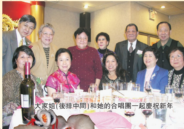
大家姐(後排中間)和她的合唱團一起慶祝新年