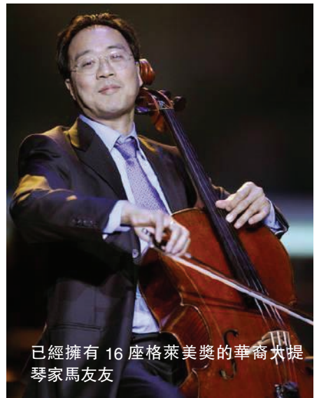
已經擁有 16 座葛萊美獎的華裔大提琴家馬友友

首先是它的權威性。美國錄音學會是一個由眾多資深音樂人組成的機構，已在美國各地設置了 12 個地區分會和一個製作人與工程師分會，目前會員超過萬人。歌唱家、演奏家、詞作者、作曲家、指揮、攝影、解說詞作者以及音樂錄像片製作人等 15 類專業人員均可申請擔任評委，但只有那些至少已有 6 件作品出版發行的人才有資格擔任此職。沒有真才實學和對音樂事業缺乏執著追求的人一般是進不了評委會的。由如此眾多資深專業人士組成的評委會理所當然地會受到音樂愛好者的信任。