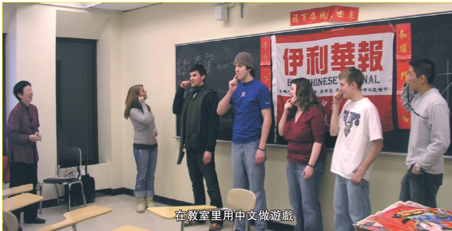
在教室里用中文做遊戲

讓世界瞭解中國, 讓中國走向世界, 這不是一句口號。我們看到了很多“中國製造”在世界各地, 我們的眼光應該更加高遠, 傳播我們的語言和文化, 讓世界出現更多的“中國傳播”目前全世界學習漢語的人數已經超過 3000 萬人, 包括 100 多個國家的大學和很多的小學, 都開設了漢語課程。據說在紐約最近發生這樣一種現象, 對會說中文的媽媽的需求大增, 以致于會中文的媽媽的工資能夠比一般的媽媽高出 $20,000 美元, 有一位媽媽甚至得到了 $70,000 美元的工資。如果您的工作不理想, 改教中文也是一個很好的就業機會, 全球中文熱的上升, 標誌着中華民族地位的深化。