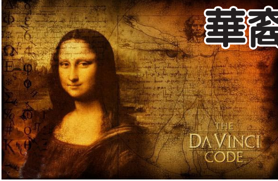
THE DA VINCI CODE

在法國巴黎近郊,有座名為維萊特的城堡,它還有一個身份:小說《達·芬奇密碼》中提彬爵士的住所。提彬自然是作者杜撰的人物,事實上維萊特城堡真正的主人是個出生在上海的美籍華裔女子。她的名字叫奧莉維亞·徐·戴克。