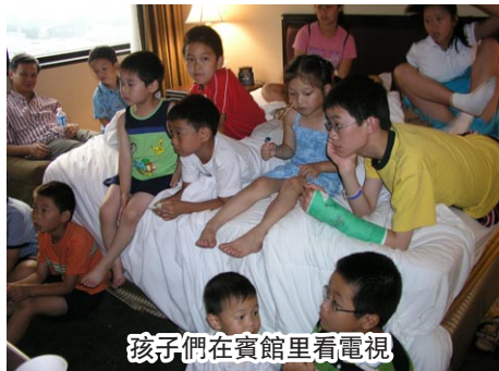
孩子們在賓館里看電視