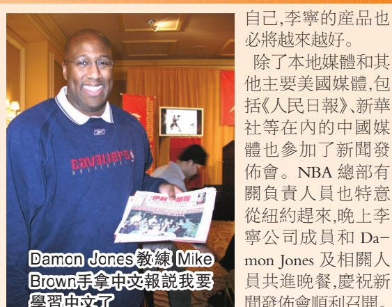
Damon Jones 教練 Mike Brown 手拿中文報紙說我要學習中文了

自己,李寧的產品也必將越來越好。除了本地媒體和其他主要美國媒體,包括《人民日報》、《新華社》等在內的中國媒體也參加了新聞發布會。NBA 總部有關負責人員也特意從紐約趕來,晚上李寧公司成員和 Damon Jones 及相關人員共進晚餐,慶祝新聞發布會順利召開。