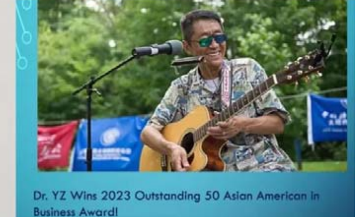
Dr. YZ Wins 2023 Outstanding 50 Asian American in Business Award!