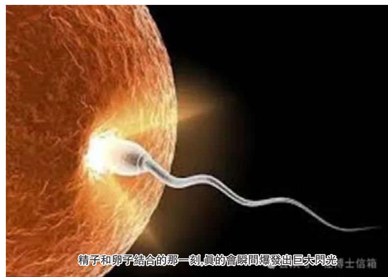
精子和卵子結合的那一刻,真的會瞬間爆發出巨大閃光

二、人體是怎樣衰老的? 從中醫的角度,人的壽命應該是100歲以上,但是人的衰老是從50歲開始的,人體的五臟按照肝、心、脾、肺、腎的順序,每10年,衰老一