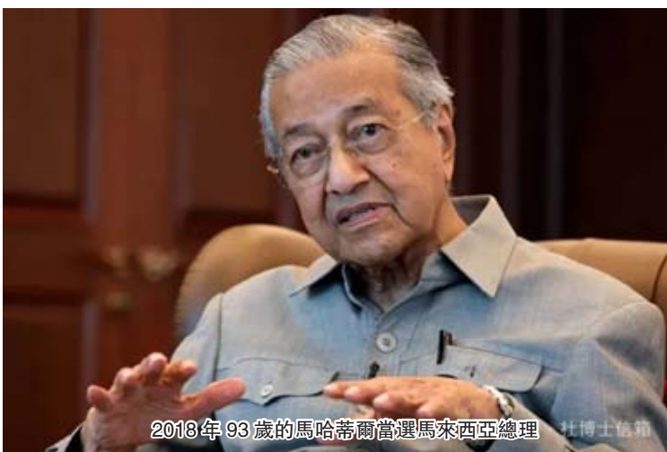
2018年93歲的馬哈蒂爾當選馬來西亞總理

良好的生活習慣,調理和治療各種慢性病。對於身體上一些小的“泄漏點”也要仔細調理,關好後門,減少“漏氣”。儘量減少和補上“泄漏點”。中醫中藥的調理就是很好辦法;