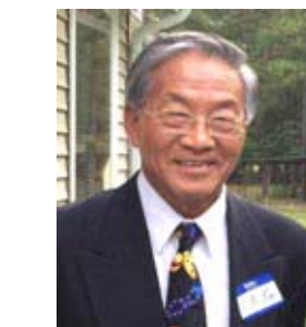
匹茲堡華人老朽 海老 KK