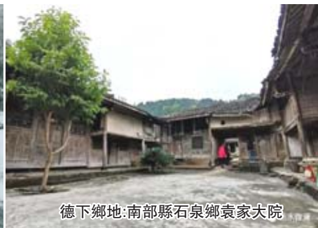
德下鄉地:南部縣石泉鄉袁家大院