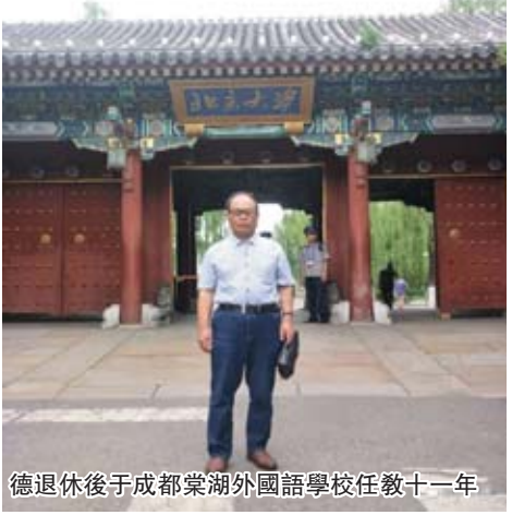
德退休後于成都棠湖外國語學校任教十一年