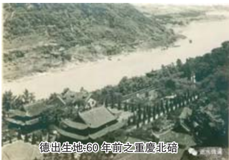
德出生地:60年前之重慶北碚