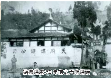
德擔煤處:70年前之天府煤礦