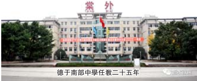
德于南部中學任教二十五年

甲子年壬申月,卅四歲,調南部中學。覓得治學之淨土,盼來育人之良壤。遂拳腳大展,心眼宏