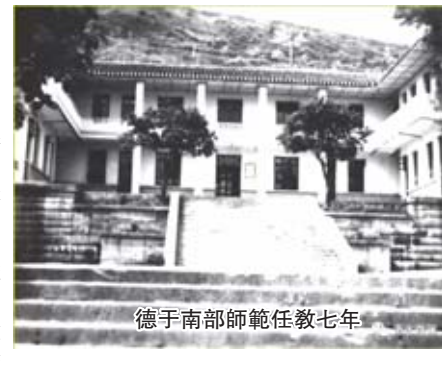
德于南部師範任教七年