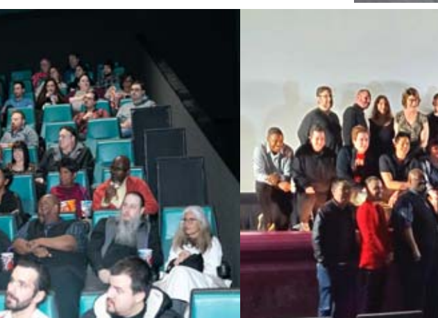
Movie Premiere: "Bullets, Brothers and Blood"

photography from Discovery Photo, as well as interview outlets such as tv20, the red carpet emulated the excitement of a Hollywood film.