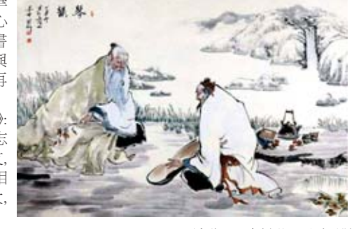
人心不同，不必強求。《左傳》中寫道：“人心之不同，如其面焉。”

不說無心之過。《道德經·第二十三章》里講：“希言自然，故飄風不終朝，驟雨不終日。”