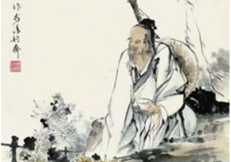
齊白石想起了昨天之事，很是愧疚，連忙道歉。梅蘭芳毫不介意的說：“無妨，這不是你有心為之的。”