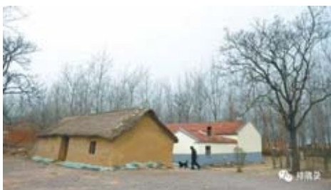
定遠縣九梓村,他曾在這座茅草老屋住過一個月

★他是插隊知青。1974年在安徽鳳陽縣大廟公社東陵大隊插隊,白天下田勞作,夜晚挑燈夜讀,他在那里深深瞭解了什麼是飢餓與貧困,其吃苦耐勞的品格和才幹,深得鄉親們的擁戴,不久後便擔任大廟公社大廟大隊黨支部書記。