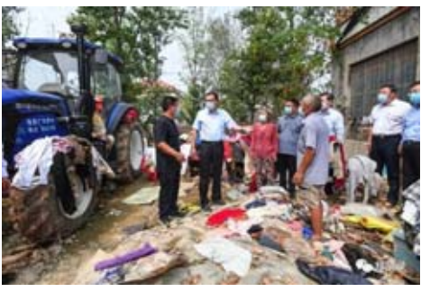
2021年8月18至19日,考察河南洪災受災群眾

以十年為跨度,我們聽到的是表態,看到的卻是市場主體的層出不窮、生機勃勃,以及熙熙攘攘的人間煙火。從歷史的長河看,十年只是短短的一瞬,但每一個人的奮進都將彙聚成時代的潮流,每一個階段的成長都關乎宏觀經濟關乎民生福祉,每一次的進步都會讓我們越來越接近理想和未來。