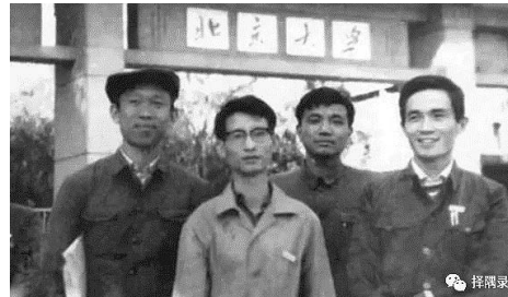
他(右二)與同學在北大南門合影

★他是北大博士。1977年恢復高考第一年,他從萬千學子中脫穎而出,考入北京大學法律系,很快被推選為學生會負責人,1980年在校“五四”科學討論會上,他寫的《法治機器與社會的系統、信息及控制》被學校評為優秀論文;1981至1982年間,他先後在報刊上發表了學術論文《關於法治系統控制過程的探討》和學術譯文《南斯拉夫的合資經營企業》。他的博士論文《論我國經濟的三元結構》,榮獲中國內地經濟學界最高獎項——孫冶方經濟科學獎的論文獎。