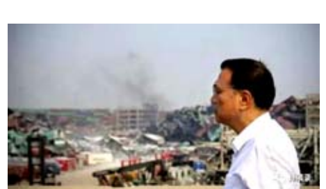
2015年8月16日,至天津查看爆炸現場

2014年,在回答“今年的改革最應該從哪些領域突破”時,他說,基本取向就是讓市場發力,激發社會的創造力,政府盡應盡的責任,讓人民受惠。