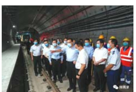
2021年8月18至19日,考察鄭州地鐵5號線受災現場