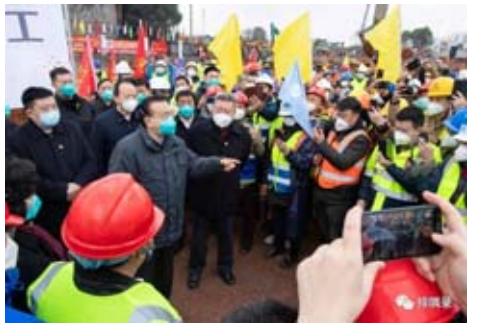
2020年1月27日,實地考察火神山進度

2021年,在回答經濟政策時說,一時走得快不一定走得穩,只有走得穩才能走得有力。我們還是希望中國這樣一個巨大的經濟體,經濟能夠行穩致遠,保持長期向好。