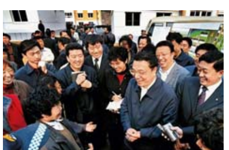
2005年11月3日,在撫順與棚戶區改造搬遷新居的群眾親切交談。

★他被境外媒體稱為“破解複雜難題的能手”。2008年,化解國際金融危機對中國衝擊;2009年推進新醫改,防治甲型流感;2010年,處理食品安全問題;2012年,“督陣”營業稅改徵增值稅試點;制定十二五規劃;