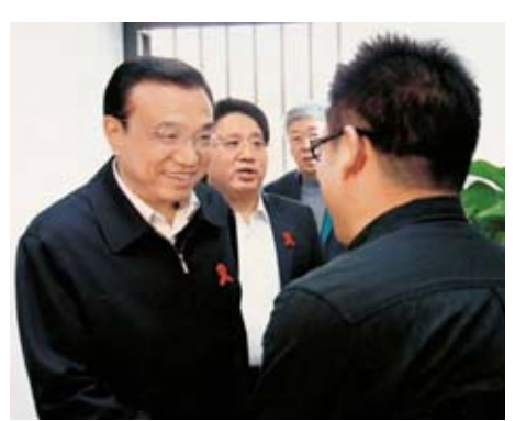
2011年11月18日,在北京市考察調研艾滋病防治工作,與艾滋病感染者握手並親切交談

★他遏制了艾滋病蔓延勢頭。2002年擔任省委書記後,立即把解決艾滋病問題列為工作的重中之重,他多次深入病情嚴重的鄉村和患者家中,主動與他們握手,促膝攀談,組織力量開展了全國首次省級艾滋病情普查,組織省直部門對口幫扶38個重點村。他強調既要摸清實情又要維護病人隱私權,體現人文關懷,並確立了患者“四有一不”的權益機製,成為國家現今對艾滋病患者“四免一關懷”政策的前奏。到2004年,河南艾滋病蔓延的勢頭得到根本遏制。