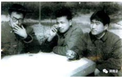
1976年,他(中)與兒時玩伴在合肥逍遙津公園合影

★他是北大博士。1977年恢復高考第一年,他從萬千學子中脫穎而出,考入北京大學法律系,很快被推選為學生會負責人,1980年在校“五四”科學討論會上,他寫的《法治機器與社會的系統、信息及控制》被學校評為優秀論文;1981至1982年間,他先後在報刊上發表了學術論文《關於法治系統控制過程的探討》和學術譯文《南斯拉夫的合資經營企業》。他的博士論文《論我國經濟的三元結構》,榮獲中國內地經濟學界最高獎項——孫冶方經濟科學獎的論文獎。