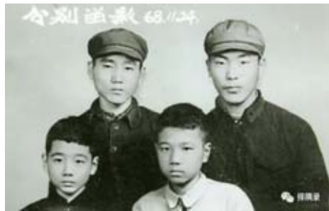
1968年,他(前排右)送朋友下鄉時的合影