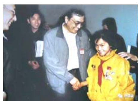
金寨縣希望小學圓了很多貧困孩子的上學夢

1996年,他在北京接見了蘇明娟等人 ★他是第一位博士省長。至地方工作,面對“浮夸風”,他多次強調河南省情有其特殊性,人口多、底子薄,要多幹事、不張揚,低調少說,避免浮躁,踏踏實實幹幾年,河南就會變樣。他所提出的“中原崛起”、“鄭東新區”、“中原經濟群”的概念,成功驅使河南由農業大省向工業大省成功扭轉。