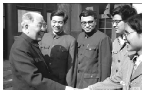
團委共事珍貴照片

★他是團幹部。畢業留校後擔任團委書記,年底被選為團中央常委,三年後,年僅30歲的他被增選為團中央書記處書記。在團中央工作期間,他在安徽省金寨縣為全國第一所“希望小學”選址。他堅信,“希望工程”是雪中送炭,要用這溫暖的炭火燃起老區孩子的希望。兩個月後,全國第一所“希望小學”在安徽金寨誕生。此後,“希望工程”、“青年文明號”、“青年志願者”等活動如火如荼燎原全國,開創性地探索了用社會力量促進社會發展的方法和途徑。