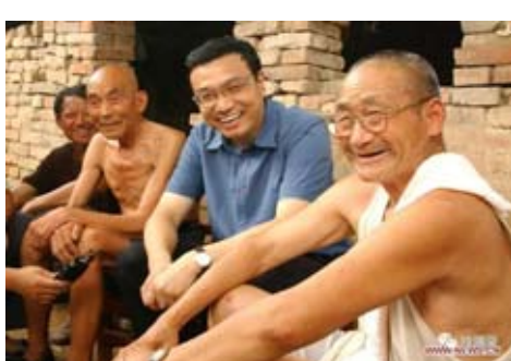
2003年8月8日,在河南新鄉調研,與原陽