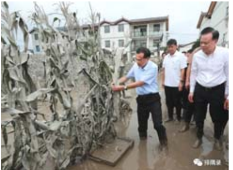
2020年8月23日,考察重慶受災地區

2022年,他強調“長江黃河不會倒流,中國開放40多年,發展了自己也壯大了別人,這是個機遇的大門,我們絕不會關上”。