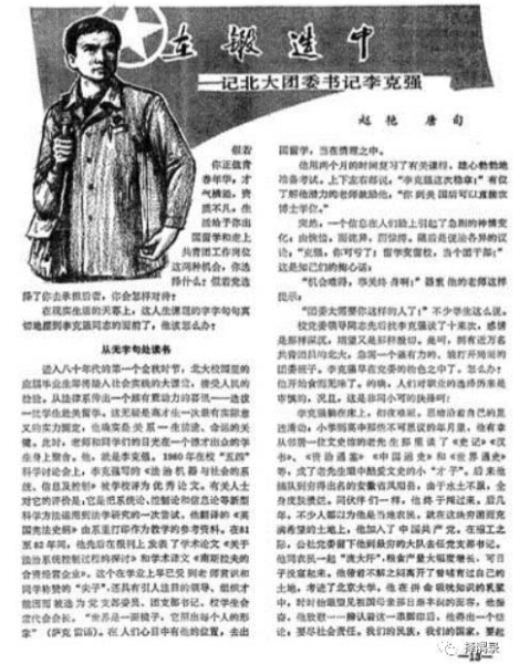
《中國青年》1983年第3期通訊稿,這是他最早的人物報道

★他是團幹部。畢業留校後擔任團委書記,年底被選為團中央常委,三年後,年僅30歲的他被增選為團中央書記處書記。在團中央工作期間,他在安徽省金寨縣為全國第一所“希望小學”選址。他堅信,“希望工程”是雪中送炭,要用這溫暖的炭火燃起老區孩子的希望。兩個月後,全國第一所“希望小學”在安徽金寨誕生。此後,“希望工程”、“青年文明號”、“青年志願者”等活動如火如荼燎原全國,開創性地探索了用社會力量促進社會發展的方法和途徑。