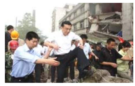
2008年5月19日,至四川地震災區協調抗震救災工作

★他被境外媒體稱為“破解複雜難題的能手”。2008年,化解國際金融危機對中國衝擊;2009年推進新醫改,防治甲型流感;2010年,處理食品安全問題;2012年,“督陣”營業稅改徵增值稅試點;制定十二五規劃;