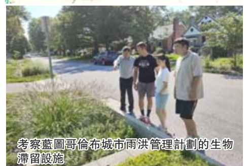
考察藍圖哥倫布城市雨洪管理計劃的生物滯留設施