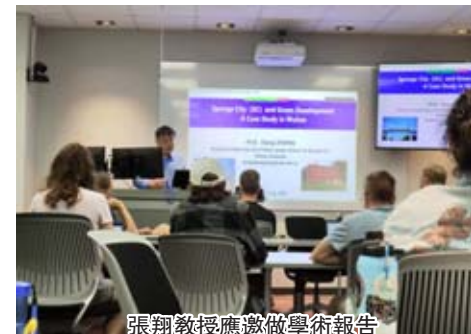
張翔教授應邀做學術報告

8月22日張翔教授應邀做了以“海綿城市與綠色發展-以武漢市為例”的學術報告,介紹了中國海綿城市理念以及其發展歷程,交流了生物滯留設施和“綠-灰-藍”耦合的系統化應對城市水問題的研究成果,並與到場專家學者進行問答和討論,探索了城市雨洪管理和綠色發展的未來方向。