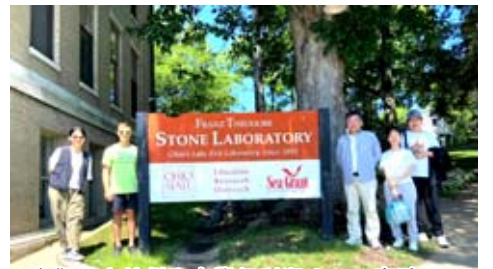
參觀俄亥俄州立大學伊利湖 Stone 實驗室