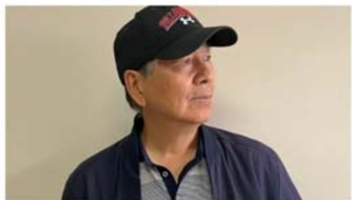
Immigrant seniors lonelier than those born in Canada but research lacking: StatCan

今年 6 月發表在《英國醫學委員會老年病學》(BMC Geriatrics)雜誌上的一項研究稱,對安省 968 名移民和 1703 名在加拿大出生的成年人進行的調查顯示,心理和身體健康