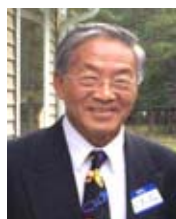
匹茲堡華人老朽 海老 KK