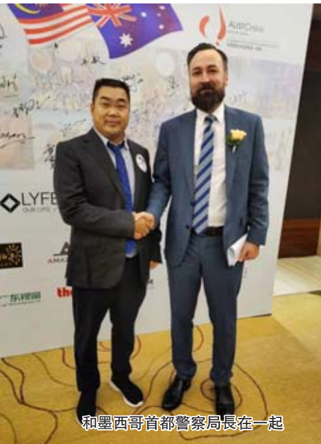
和墨西哥首都警察局長在一起