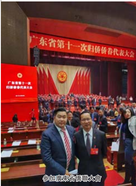
參加廣東省僑聯大會