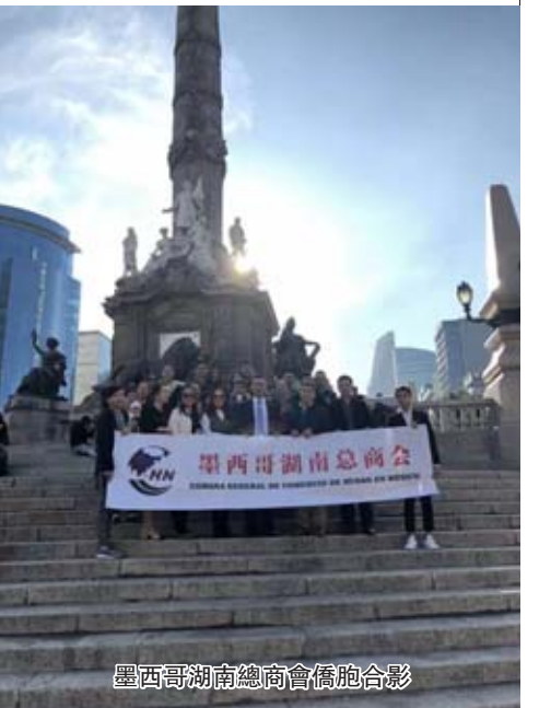
墨西哥湖南總商會僑胞合影