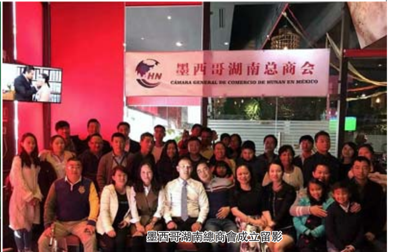
墨西哥湖南總商會成立留影