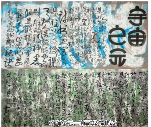
《宇宙之元-前言》(2幅作品)

和自由而戰鬥,他所經歷的一切,以及被迫從自己的國土離開,然後漂浮在這與那之間,在不確定的空間里,這是勇士的生活。成為一名書法家也是成為一名越獄的英雄 -- 不過我這裡的越獄是指超越自己,打破任何形式的限制、界限、障礙、老模式、老思維和老行為的監獄。當我說老,我指的是那些在自我認識中發現的不屬於自己的東西 -- 也就是那些不屬於大我的東西,包括防禦心、猜疑心、後悔心、自私心、嫉妒心、羞恥、錯誤行為,等等。事實是你突破的越多,你站得越高,你也越自由,書法的表達也就越自然高雅。