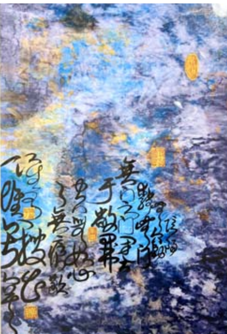
《斑斕的黑暗 無象世界之「象」》15號 2017年

線條組成的空間和字體風格的表情在書法家的調息中既隨機應變而又不失精心編排;撇鈎的能量往往以內收,巧妙地揭示隱藏在藝術家內心深處的挫折和束縛,也好比他的靈魂一直走在回歸故園的路途中。