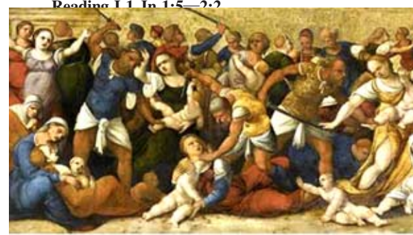
The Killing of Holy Innocents by th...

Christmas Mass at Our Lady of Mount Carmel Catholic Church (West)! Some of my grandchildren! Blessed "God rest ye merry gentlemen ... let nothing you dismay Remember Christ our Savior was born on Christmas Day! Feast of the Holy Innocents, martyrs Reading 1.1. In 1:5-2:2