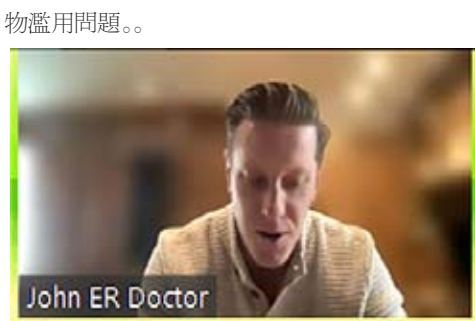
John, an ER Doctor from a major western city (he has agreed to speak on condition of anonymity).

在美國每一週攝取假的處方藥片及摻有芬太尼糖果的兒童及青少年病的非常嚴重或奄奄一息。同時 P2P,一種非常容易製造類似冰毒的合成藥物,正在摧殘著美國的街道的及造成上癮的增長,嚴重的心理健康及遊民。12月9日上午少數族裔媒體服務中心(Ethnic Media Services)邀請急診科醫生以及資深專著作家等與少數族裔媒體記者舉線上會議("The Fentanyl and Meth Double Menace — the impact of powerful synthetic drugs in the economy, the rise in homelessness and youth fatalities")。圍繞會議的主題“芬太尼及冰毒的雙重威脅。強勁的合成藥物對經濟的影響,遊民的增長及青少年的死亡案件”展開研討,並介紹了美國近幾年的藥物濫用問題。