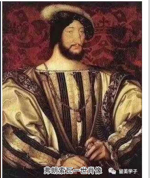
弗朗索瓦一世肖像