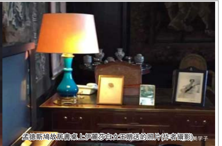
孟德斯鳩故居書桌上伊麗莎白女王贈送的照片