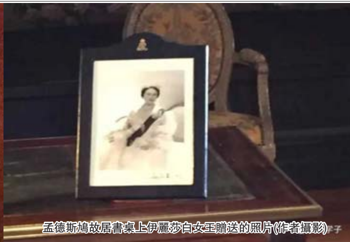
孟德斯鳩故居書桌上伊麗莎白女王贈送的照片