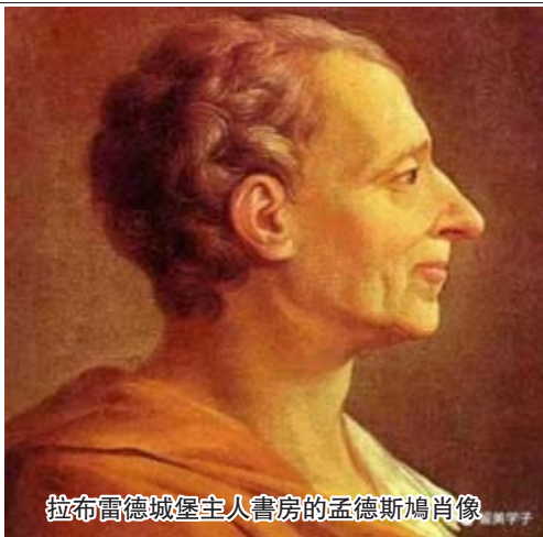
拉布雷德城堡主人書房的孟德斯鳩肖像