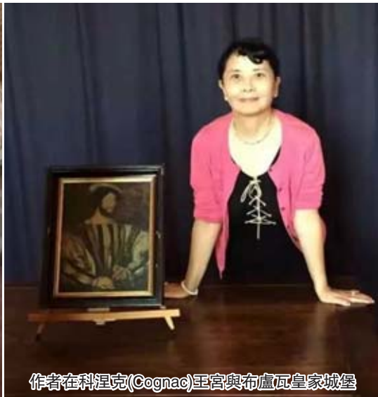
作者在科涅克(Cognac)至宮與布盧瓦皇家城堡