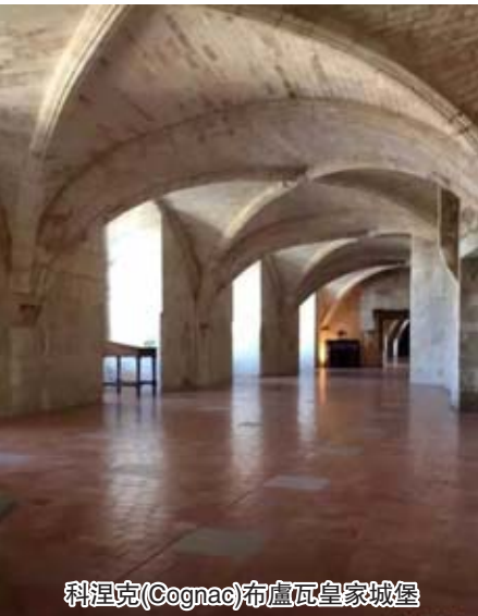
科涅克(Cognac)布盧瓦皇家城堡