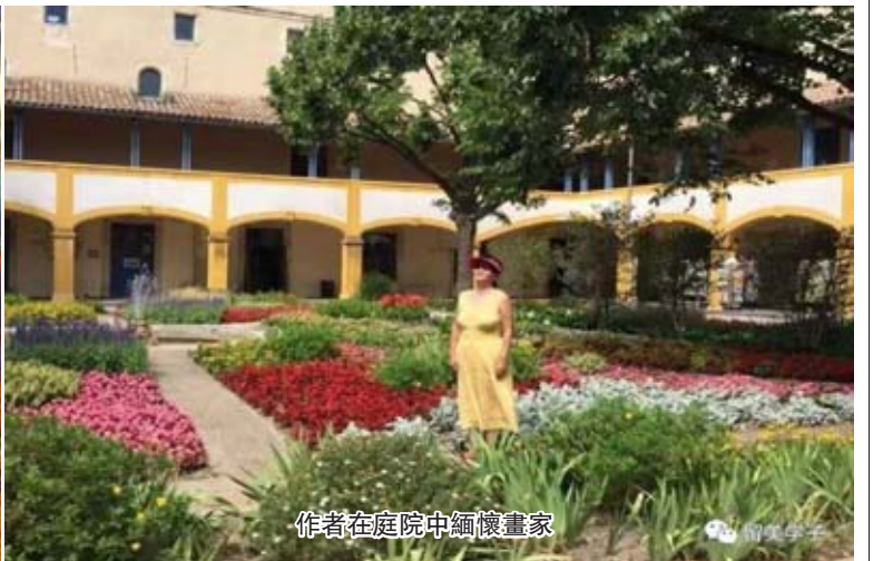
作者在庭院中緬懷畫家