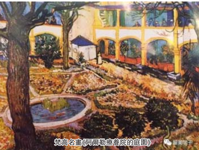
梵高名畫《阿爾勒療養院的庭園》