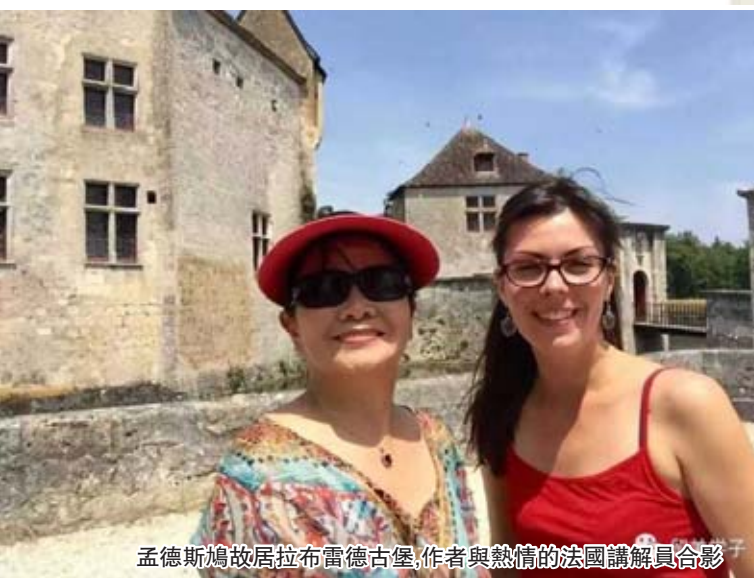
孟德斯鳩故居拉布雷德古堡,作者與熱情的法國講解員合影