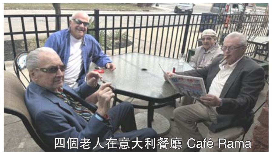
四個老人在意大利餐廳 Café Rama