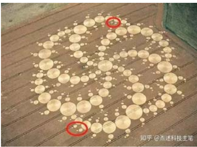
知乎@高述科技主筆

自2017年6月3日開始移星後,飛碟就可以開足馬力給太陽加氫氣了。移星可以使地球溫度降低,加氫氣可以使地球溫度升高,兩者達成新的溫度平衡。