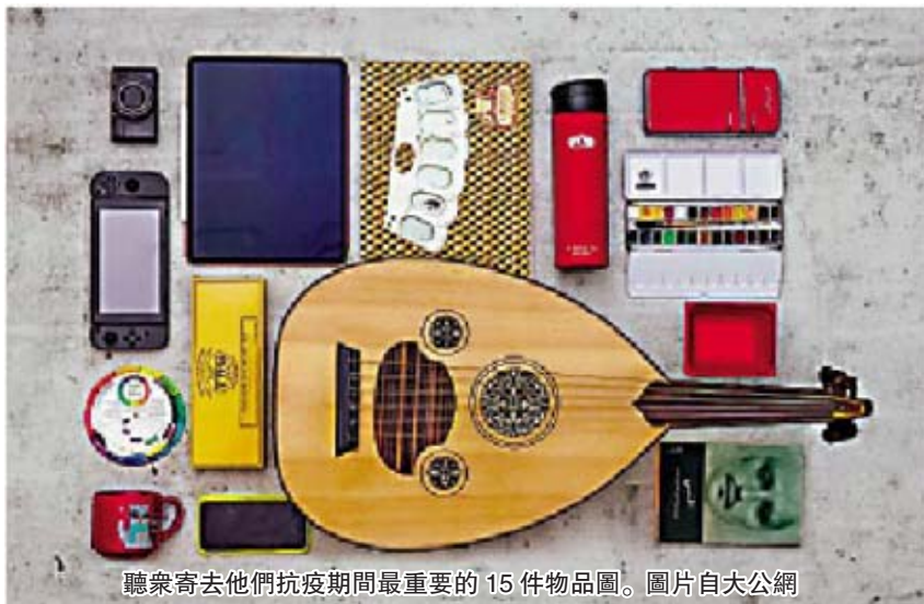
聽眾寄去他們抗疫期間最重要的15件物品圖。

除了抒情的視覺敘述，本期還有一個樸素的“記敘文體”或者視覺說明文體。題目就是“疫情期間你生命中不可或缺的15個物件”的徵圖。它要求人們把你認為最重要的15件東西集中在一張照片中拍照投稿，由讀者和視覺