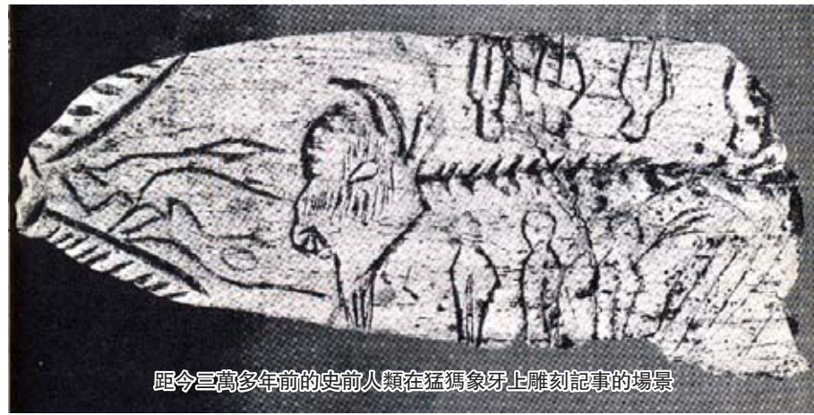
距今三萬多年前的史前人類在猛獁象牙上雕刻記事的場景

這次所徵圖片來自大半个地球，美國、墨西哥、印度、日本、巴西、哥倫比亞、厄瓜多爾、菲律賓、肯尼亞、科威特、斯洛文尼