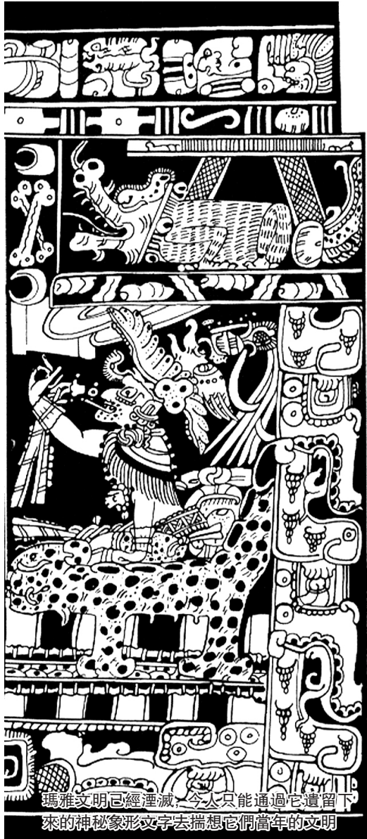
瑪雅文明已經滅絕，今天只能通過它遺留下來的神秘象形文字去揣想它們當年的文明

其實，今天邀請全世界讀者用圖片投稿表達心聲的這個想法並不新，早在上世紀1951年這個方法就被視覺人類學家實施用做 cultural inventory (文化清倉驗核)調查了。它稱得上是個古典方法。不過，我認爲現在它又舊瓶裝新酒被加上了新意，這種新意或者可以被稱作 visual inventory (視覺清倉驗核)。用自供圖片剖露心迹是