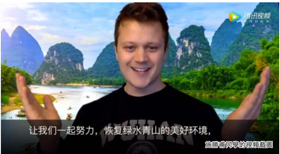
让我们一起努力,恢复绿水青山的美好环境,