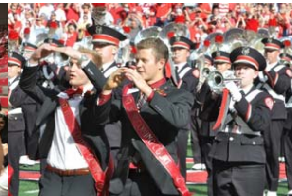
Homecoming 校友返校日活動 King "國王" (高年級學生發表競選演講,由票選最高的男生獲得)