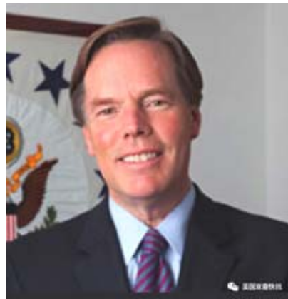
(圖)美國國務院前副國務卿伯恩斯(Nicholas Burns)。

伯恩斯現任哈佛大學國際關係和外交實踐教授。教育背景包括波士頓學院歷史專業歐洲史方向學士,約翰霍普金斯大學國際關係碩士。會說法語,希臘語,阿拉伯語。伯恩斯是職業外交家,在很多大學和公司進行收費演講,包括 Goldman Sachs, Bank of America, State Street, CitiBank, Honeywell, 獲得了眾多獎章和榮譽學位。他是希拉里競選團隊的非正式外交顧問和拜登競選團隊的外交顧問。