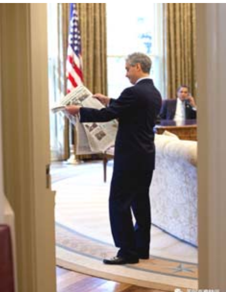
(圖)擔任白宮幕僚長的伊曼紐爾 (Rahm E-

(上圖)前芝加哥市長伊曼紐爾(Rahm Emanuel)和拜登副總統任期內的一次芝加哥活動中。