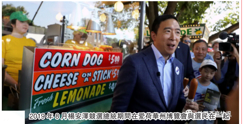
2019年8月楊安澤競選總統期間在愛荷華州博覽會與選民在一起

1999年，楊安澤從哥倫比亞法學院畢業之後在紐約市的達維律師事務所開始他的律師職業生涯。不過他在2000年就離開事務所並創辦了一家名為Stargiving.com的網站，這家網站是一個與名人相關聯的慈善籌款網站。Stargiving.com起初從投資者手中獲得了一些投資，但還是在2001年關閉了。之後，楊安澤加