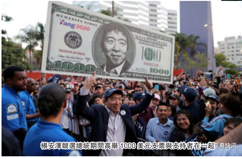
楊安澤競選總統期間高舉1000美元支票與支持者在一起

2006年，在范德霍克的要求下，楊安澤出任這家公司的首席執行官。在擔任曼哈頓備考的首席執行官期間，楊安澤給公司制定的經營策略就是主要針對研究生管理科入學考試提供備考服務。在他的經營之下，曼哈頓備考從最初的5個門店擴展到69個門店，並於2009年12月被卡普蘭公司所收購。2012年，楊安澤辭去該公司的總裁職務。