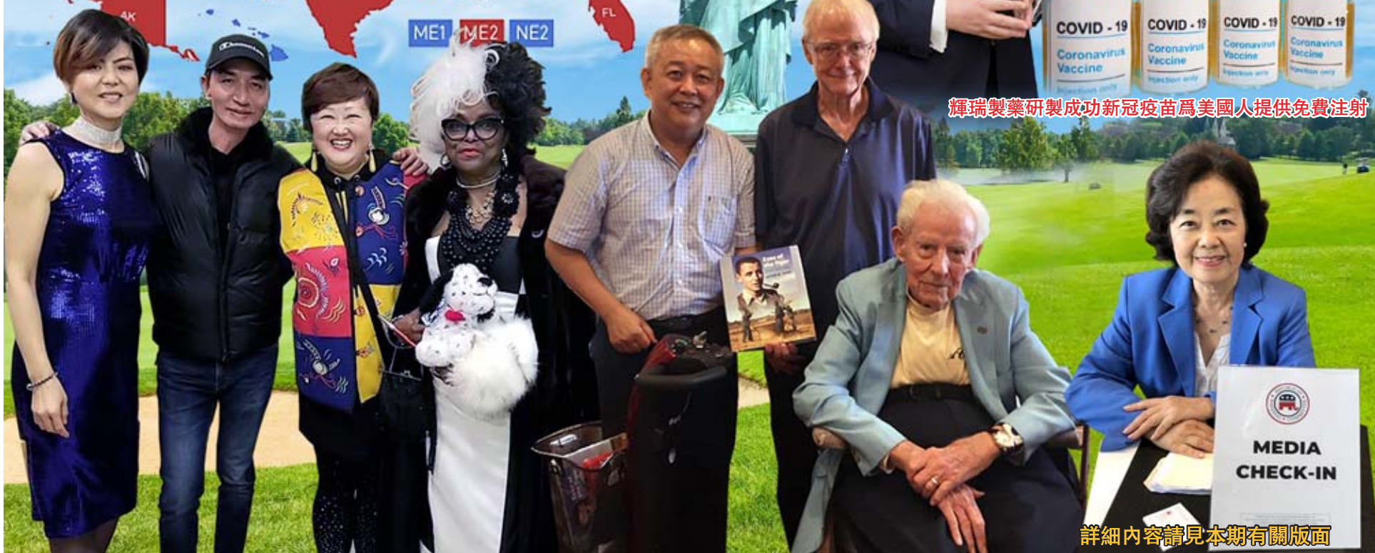
詳細內容請見本期有關版面