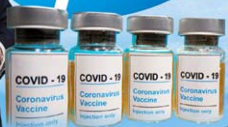
輝瑞製藥研製成功新冠疫苗為美國人提供免費注射