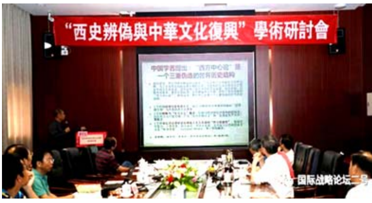
國際戰略論壇二號

中華文明要復興，就必須對世界歷史正本清源，打倒西方偽史，扶正中華文明。中國官方考古研究、民間考古研究，和西史辨偽研究，都是不可或缺的力量。應該說，中國自己的考古研究相當於從內部反擊西方偽史和偽史話語體系，西史辨偽研究可以看作是外線作戰。由於西方偽史話語權的存在，中國考古研究的成果西方可以不承認，國際學術界也就不予認可，所以需要中國的考古研究與西方文獻的對照，那麼中國民間自發的西史辨偽研究就十分重要。希望中國官方和民間的考古研究與西史辨偽研究能夠合作，全力為匡正人類歷史，復興中華文明而努力。