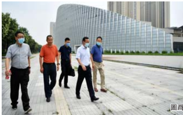
圖為中國新聞社社長陳陸軍一行調研世界華文傳媒國際交流中心項目。

研了世界華文傳媒國際交流中心項目,並對項目建成表示肯定。在項目現場,陳陸軍社長指出,要整合中新社資源,在依法合規的前提下抓緊項目推進,更好地服務海外華文媒體和華僑華人。