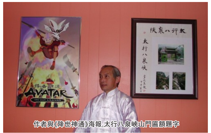
作者與《降世神通》海報,太行八泉峽山門匾額題字