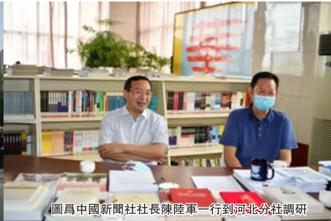
圖為中國新聞社社長陳陸軍一行到河北分社調研

二是要加強業務建設。在媒體融合的大趨勢下,分社要做好媒體融合工作,推進各項採編業務深度融合發展。