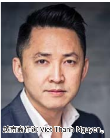
越南裔作家 Viet Thanh Nguyen。