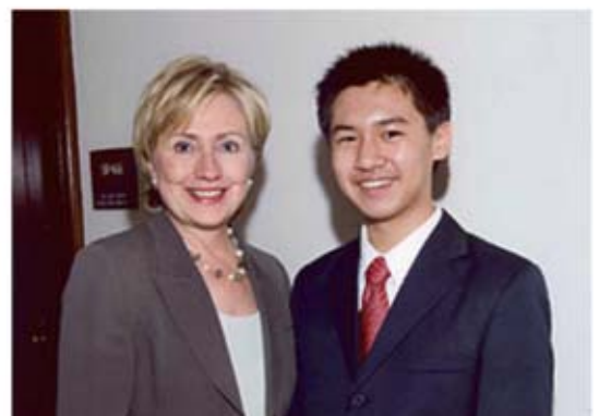
Hillary Clinton with Tao, in 2008, to recognize his being named a Davidson Fellow Laureate