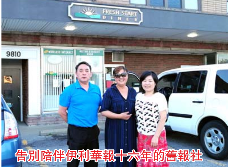
告別陪伴伊利華報十六年的舊報社