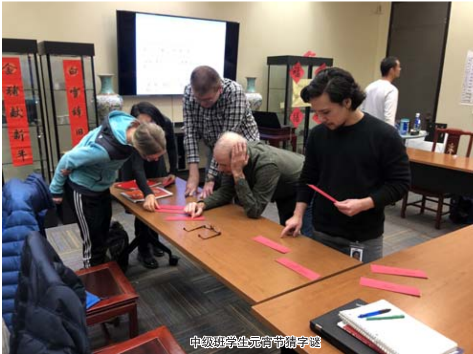
中级班学生元宵节猜字谜