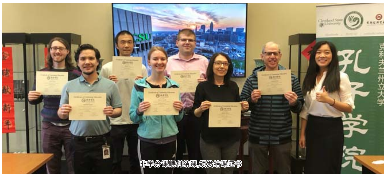
非学分课顺利结课,颁发结课证书

转眼我的两年任期即将结束,回想这两年,课堂上始终充满了欢乐,学生乐在其中,我也很是享受。庆幸自己还在坚持着初心,没有沦为一个无趣的老师。以后的路还很长,不论在哪儿,我都告诉自己,要继续做一个有趣的人,上有有趣的课。