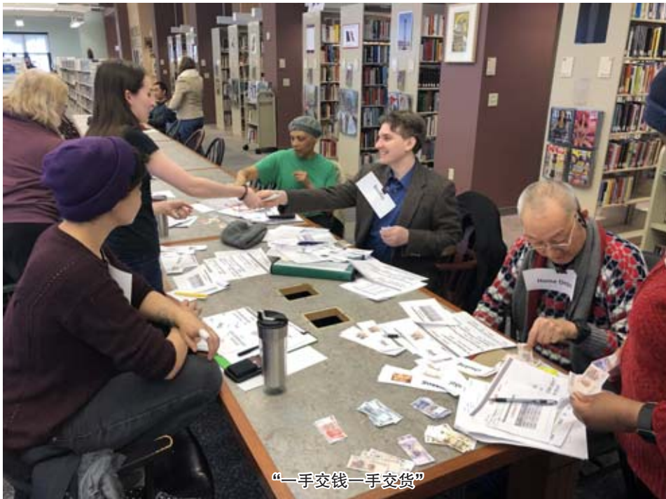
“一手交钱一手交货”