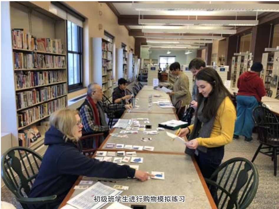
初级班学生进行购物模拟练习