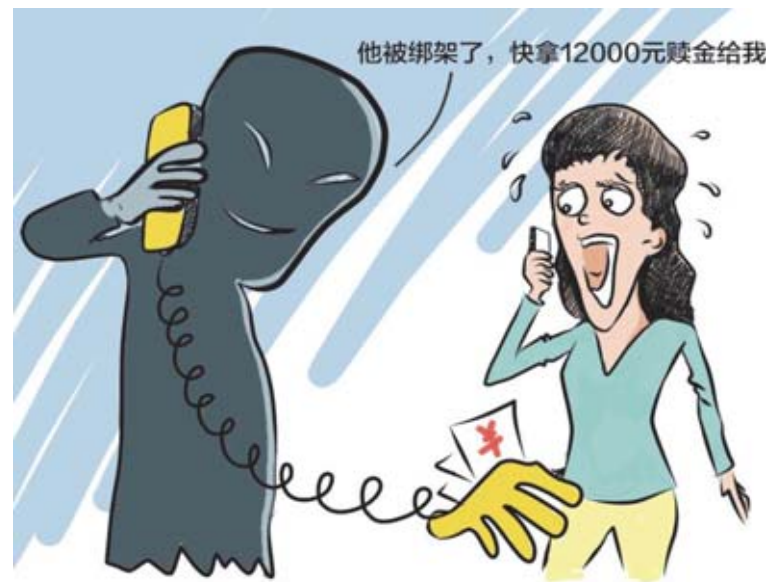
他被綁架了，快拿12000元贖金給我

從2018年10月到現在，3個多月，電話講中文的騙子鋪天蓋地。記得有一天半夜2點我還在做報紙，有一個從廣州來的電話說，有個包裹要寄到我家地址，她要核對一下，當時我說為什麼不寄到報社？電話里的她告訴我三天以後會收到。 三天後一個早上，我收到一個1/800電話，錄音用中文說：你的郵包已經送到你家，沒有人接收，要我按9，有一個男生開始與我對話，沒有多久我就告