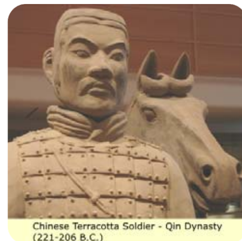
Chinese Terracotta Soldier - Qin Dynasty (221-206 B.C.)

Africanus-the Roman general that defeated Carthage in the 2nd Punic war). “About 70 thousand years ago these Alkebulanese left Alkebulan via what is called ‘the southern route’ and traveled along the coast of Asia to reach Australia around 65 to 50 thousand years ago”. “Europe was populated by these same first humans less than 55 thousand years ago, (though the present Europeans also share genetics with other ‘near humans’ such as Neanderthals). “The Shang Civilization, (later replaced by the very dark-skinned Zhou Dynasty), was one of the first in what is now called China. They, along with the Qin, (remember the terracotta sol-