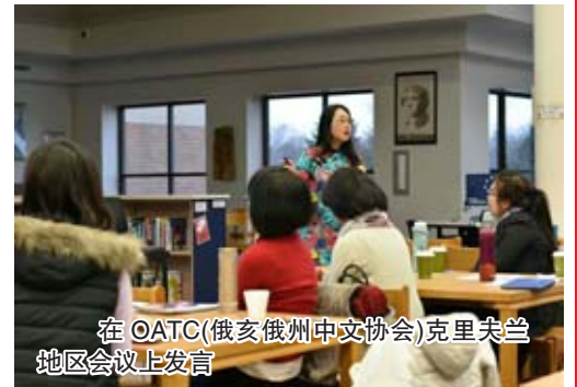
在 OATC (俄亥俄州中文协会) 克利夫兰地区会议上发言

时光荏苒,日月如梭,转眼间在美国工作已经一年半了,很幸运我能在克利夫兰州立大学与优秀的孔院领导和同事们共事,从他们身上学到了很多。在这一年半的时间里我有太多的感动,这里的一切都将成为我人生中美好的回忆。这段经历,让我不断丰富、提高,成为更好的自己。