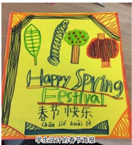
学生设计的春节海报

我们学校只开设一种外语,就是中文。我一面感到我们的母语如此得到重视而自豪,一面不由有些担心,很多学生学习中文,是不是真