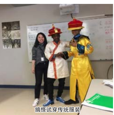
搞怪试穿传统服装

但是我需要建立和学生之间的情感联系,需要学习一些课堂管理的小技巧。于是借助网络进行恶补,其中我从 YouTube(一个视频网站)上学到了如何和学生增进感情、如何设置课堂的各个环节的活动,等等。比如,学生刚进教室都很兴奋,逮着机会就跟同学聊得热火朝天,不得安静,此时我需要 bellwork(进门作业),也就是说学生一进教室就让他们忙起来,并把这个养成习惯。又比如说,学会“二皮脸”,有些学生非常叛逆, I don't care(我不在乎)成为口头禅。过去我会想你自己都不在乎你自己,我想帮你也帮不上啊。现在我每次都会笑着说, but I care(但是我在乎)。