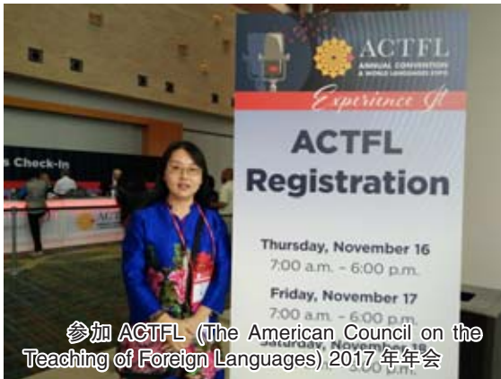
参加 ACTFL (The American Council on the Teaching of Foreign Languages) 2017 年年会

这时,孔院的领导、老师们似乎非常清楚新教师的这种状态。他们按部就班地为我们提供了各种学习和成长的帮助,孔院的美方院长