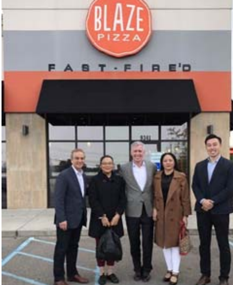
While in Cincinnati, the Linzhou Delegation enjoyed a tour and lunch at LeBron James' Blaze Pizza Restaurant

對美國加劇的老齡化市場, 普遍為 65 歲及以上的病人。在美國, 老齡化增速為普通人口的 400%, 因此對於 AHS 及類似的醫院的需求將會迅速增大。