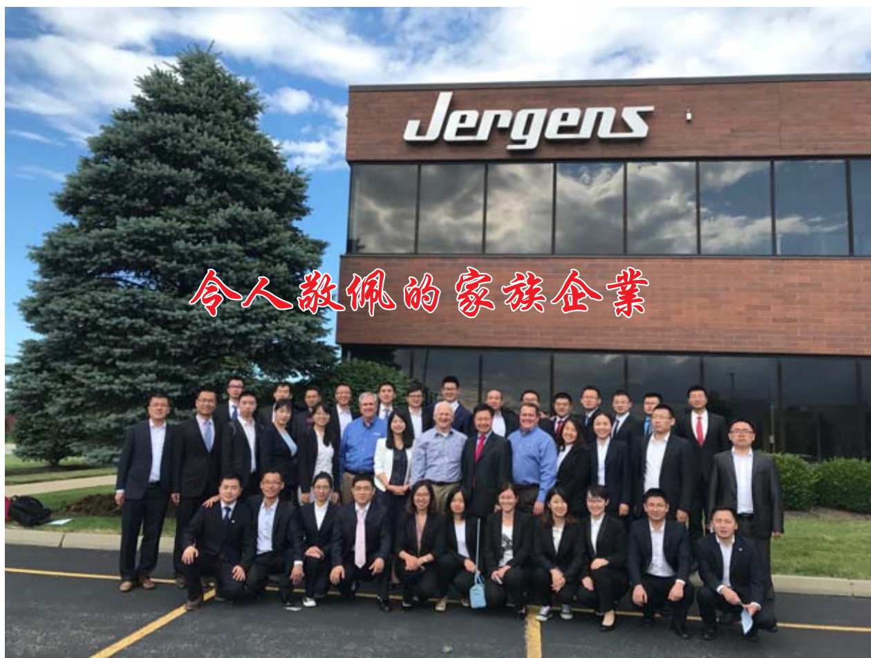
令人敬佩的家族企業

這世界沒有任何一件事情是偶然發生的。6月15日,我在從 Sandusky 印刷廠拿報紙回克里夫蘭的路上接了一個來自中國的無名電話,是我先生 1991 年 Akron 大學的林郁兆教授打來的電話,時隔 20 多年,他講話的速度提醒我這個事情的緊急:目前他是英國在中國寧波開設的諾丁漢大學的副校長,他帶一個 37 人團隊在美國一個月,這個團是中國中軍集團全中國各地的學員,他說都是未來的領導人,他們學校提供培訓 6 個月,其中 1 個月在美國或者德國,這一團隊在美國學習參觀娛樂,他希望我能建議並聯繫他們在克里夫蘭 24-26 日參觀與遊覽。