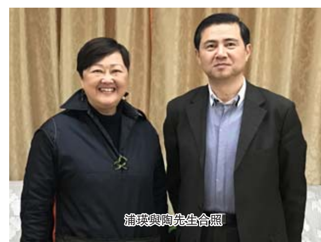
浦瑛與陶先生合照

每個人從生到死，是經歷，每一個人走的路不同，留下的是不同的足跡，把一天過得有價值，因為快樂只是在你改變的一念之間。