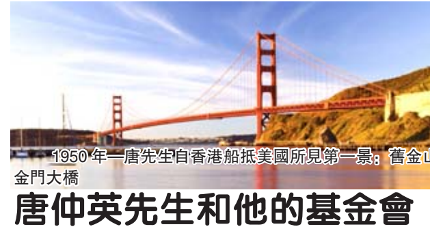
1950年一唐先生自香港乘船抵美國所見第一景：舊金山金門大橋

沒有上高中就開始吸毒，出售毒品，一個家沒有了，父親把兒子趕出家，母親永遠信任自己的孩子，從不放棄給兒子以希望，教堂的姊妹一同禱告，上帝拯救了他們一家人。人要學會不要隨意放棄，沒有一件事情是容易做的，心里要有希望的一盞燈照着你，人要有宗教信仰，因為你心里的神處處都在幫助你。