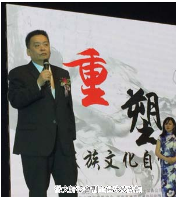
徵文評委會副主任冰凌致詞