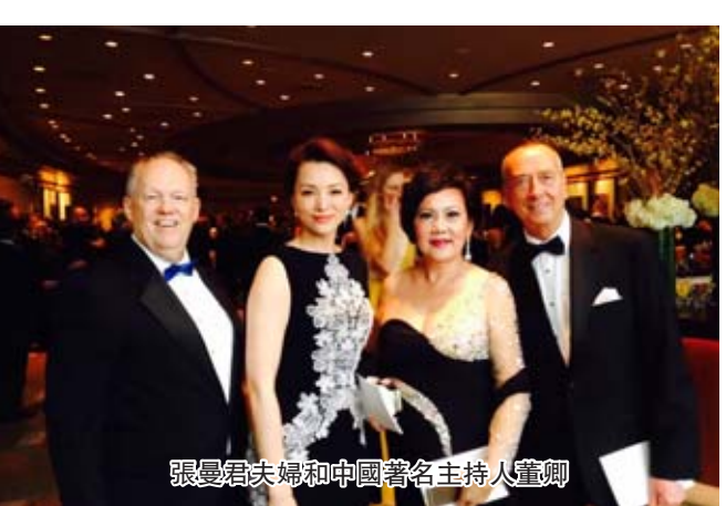
張曼君夫婦與中國著名主持人董卿