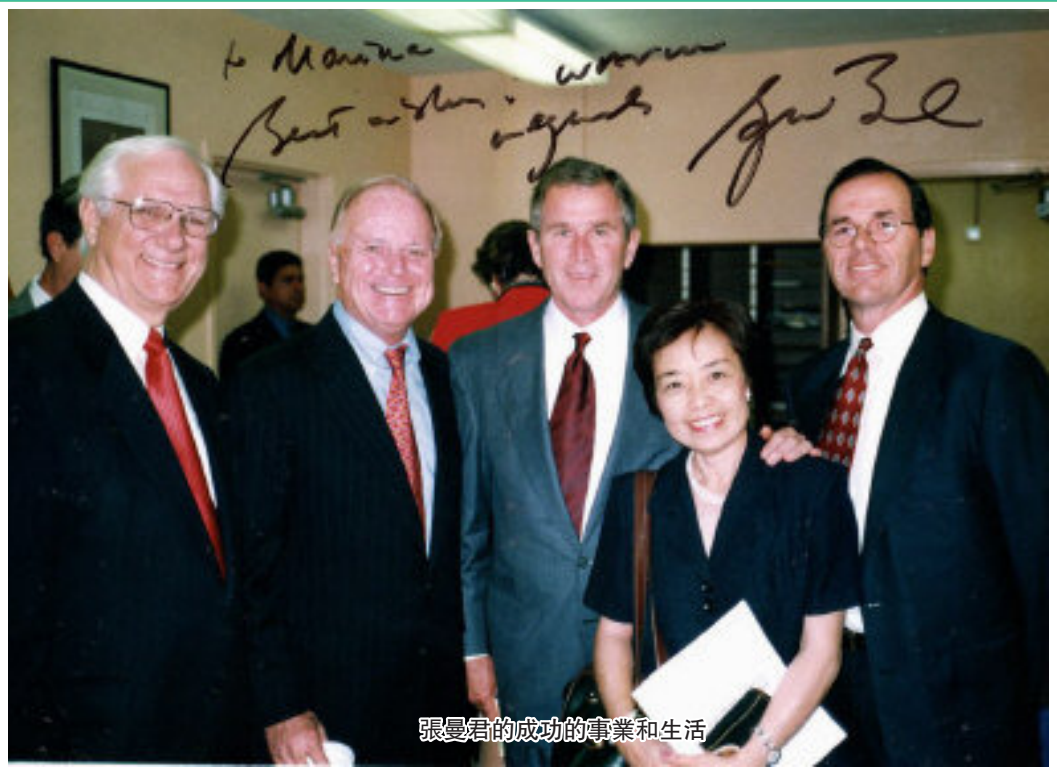
張曼君的成功的事業和生活

就在2007年,收到小布什政府勞工部部長趙小蘭的邀請,張曼君再赴白宮任職,被任命為勞工部副部長,趙小蘭看重的正是張曼君在特殊教育領域的背景,與少數族裔打交道的經驗和能力以及在教育部的工作經驗。任職三年半後,張曼君卸任美國副部長一職,結束了她在美國白宮的政治生涯。這段經歷讓張曼君更有體會:“做官可以很快改變一些事情,以前吵很久都沒有用,但是現在一個決策就可以影響很多事情”。她也勉勵我:媒體是很重要的陣地,她不止一次的鼓勵我,再困難也不要放棄你現在做的媒體,作為移民,同時又是女性,能夠為自己的族裔做一點事情是值得驕傲的。