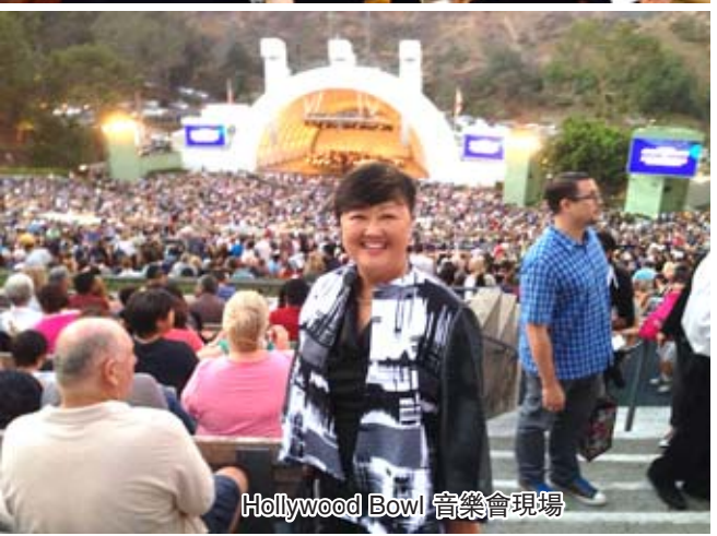
Hollywood Bowl 音樂會現場