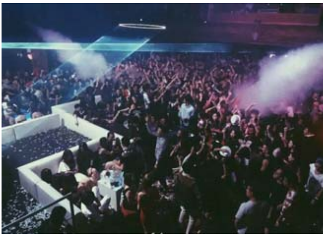
南加州留學生團體成功舉辦免費超大型萬聖節舞會 實力不容小覷

在深受美國青少年喜愛的萬聖節到來之際,由南加州留學生社團ICON UNION攜手南加州大學香港學生會(USC HKSA)舉辦的萬聖節超大型免費主題舞會The Dismaland,10月23日晚在洛杉磯市中心成功舉辦,盛況空前,超過3000名留學生和各族裔青年踴躍參與,開創南加州華人社區歷史上最大型的免費舞會記錄。