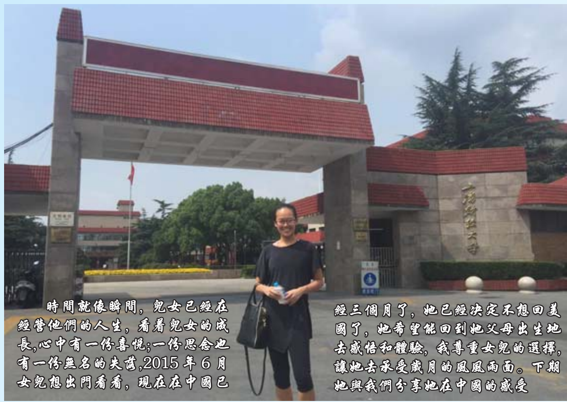
時間就像時間，兒女已經在經營他們的人生，看着兒女的成長，心中有一份喜悅；一份思念也有一份無名的失落，2015年6月女兒鬼出門看看，現在在中國已經三個月了，她已經決定不想回美國了，她希望能回到她父母出生地去感悟和體驗，我尊重女兒的選擇，讓她去承受歲月的風風雨雨。下期她與我們分享她在中國的感受