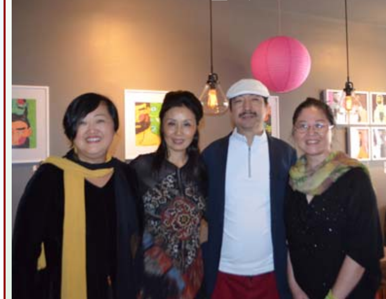
另一名朋友在上海開的餐廳此時也在慶祝中秋佳節