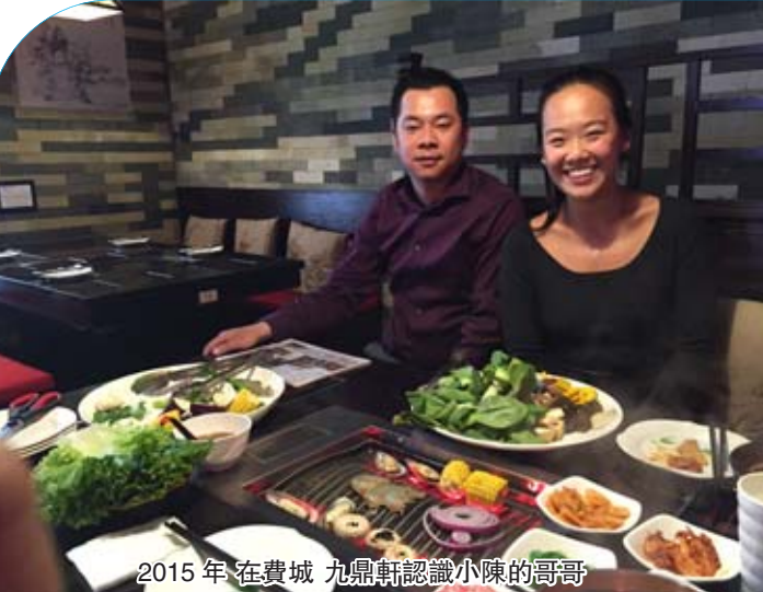
2015年 在費城 九鼎軒認識小陳的哥哥

同樣的，你每天抱怨、挑剔、指責、怨恨，你就生活在地獄里；一念到天堂，一念到地獄。你的心在哪，成就就在哪！