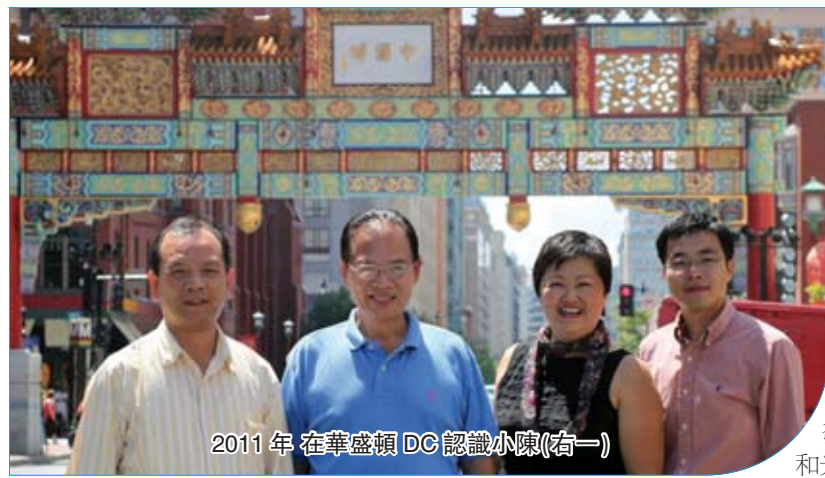
2011年 在華盛頓DC認識小陳(右一)

我們要學習的Tip 為什麼一個老闆再難，也不會輕言放棄，而一個員工做得不順就想逃走，為什麼一對夫妻再吵再