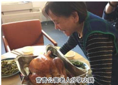
常青公寓老人分享火鷄