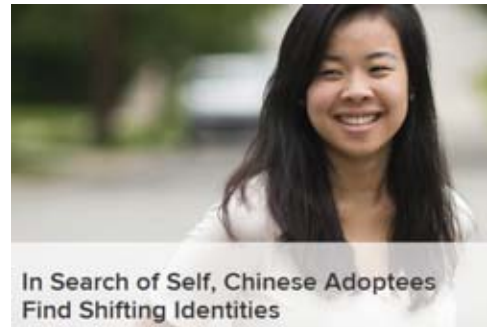
In Search of Self, Chinese Adoptees Find Shifting Identities